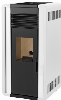
i) e iiiii)