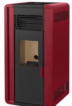
ii) e iiiii)