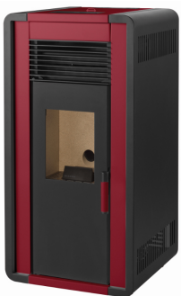
ii) e iiiii)

i) Branco / Blanco / White / Blanc / Bianco - ii) Bordeaux / Burdeos / Bordeaux / Bordeaux / Bordò - iii) Cinza / Gris / Grey / Gris / Grigio - iiii) Preto / Negro / Black / Noir / Nero - iiiii) Carvalho / Roble / Oak / Chêne / Quercia