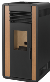
iiiiii) e iiiiiii)