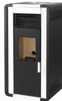
i) e iiiii)