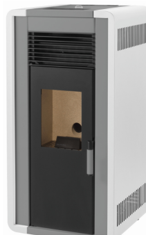
i) e iiiii)